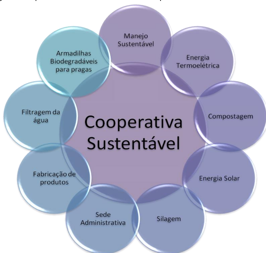
Figura 1: Propostas a serem desenvolvidas na cooperativa.

Queremos propor uma cooperativa em que possa unir os pequenos produtores, e que possibilite a sua importância social e comercial, juntando os produtos de cada fazenda e criando o próprio selo da cooperativa, além de todos os proprietários possuírem assistência da sede, com informações na forma de plantio e na troca de produtos naturais não modificados em canalização da água filtrada, energia, adubo adequado para cada plantação e informações básicas para plantio.